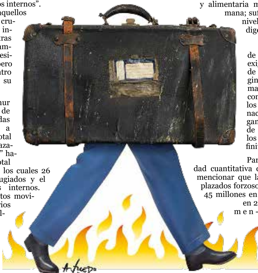
Imagen: Alfredo Sabat

Para entender la gravedad cuantitativa del problema, basta mencionar que la cantidad de “desplazados forzosos” se incrementó de 45 millones en 2010 a 71 millones en 2018; es decir, un aumento del 60%. Más grave aún, a la exacerbación de los conflictos geopolíticos ya existentes -que generan por sí mismos cada vez mayor cantidad