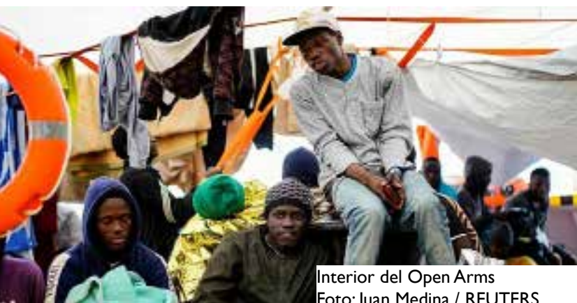
Interior del Open Arms

se sitúa en su nivel más bajo desde 2013