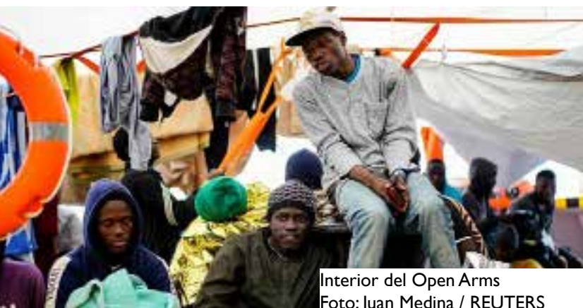
Interior del Open Arms

se sitúa en su nivel más bajo desde 2013