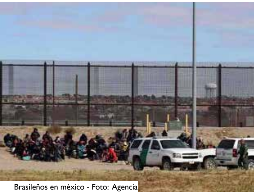
Brasileños en México

La ciudad estadounidense de El Paso (Texas) es famosa por ser uno de los puertos de entrada para inmigrantes centroamericanos que pretenden cruzar la frontera, sea legal o ilegalmente, en búsqueda de una mejor vida en EE.UU.