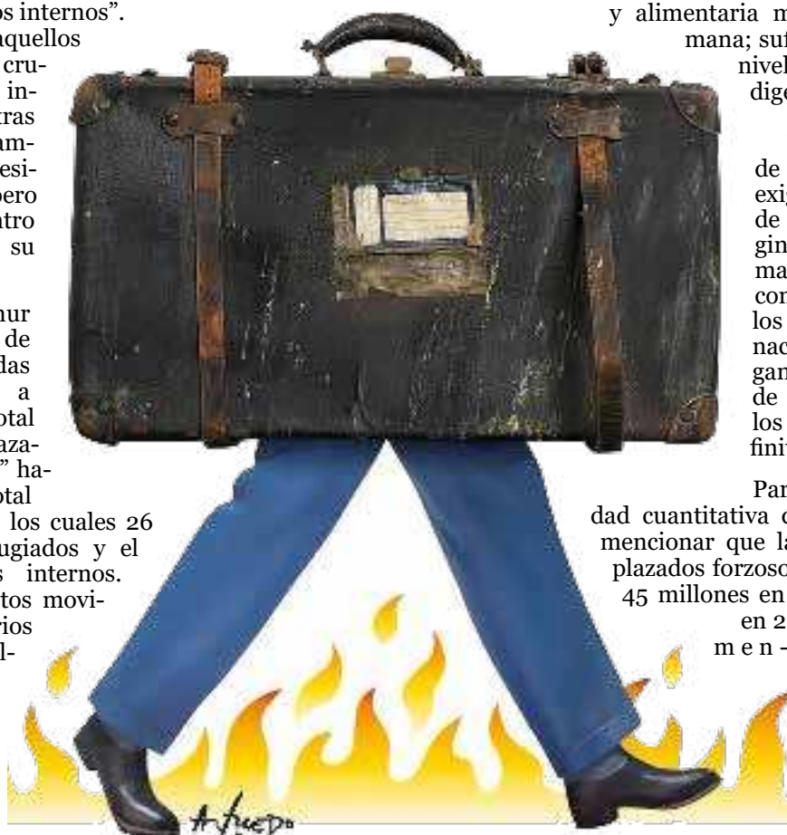
Imagen: Alfredo Sabat

Para entender la gravedad cuantitativa del problema, basta mencionar que la cantidad de “desplazados forzosos” se incrementó de 45 millones en 2010 a 71 millones en 2018; es decir, un aumento del 60%. Más grave aún, a la exacerbación de los conflictos geopolíticos ya existentes -que generan por sí mismos cada vez mayor cantidad