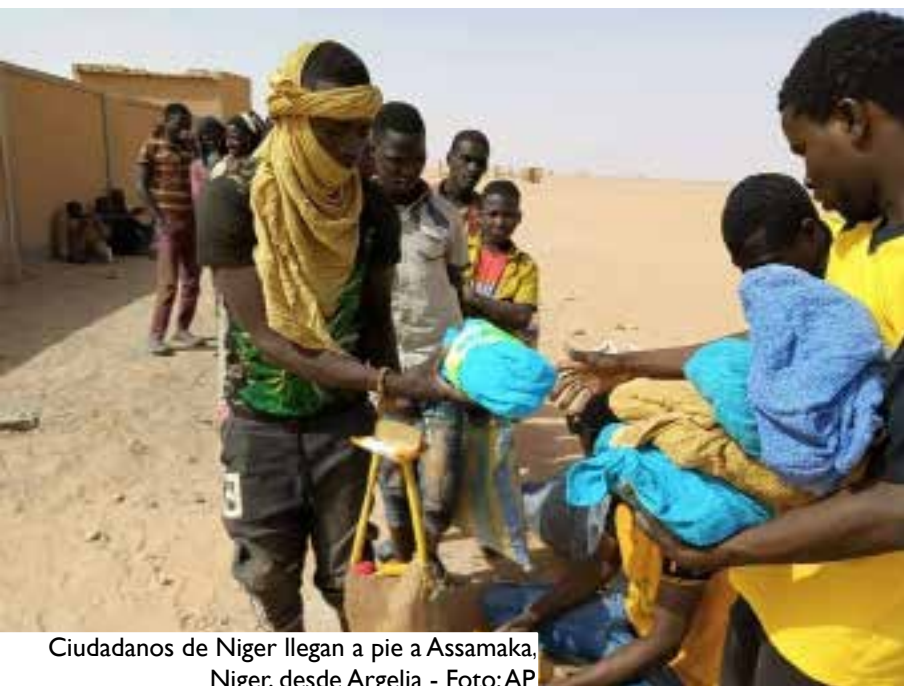
Ciudadanos de Níger llegan a pie a Assamaka, Níger, desde Argelia

“salvar vidas debe ser la principal prioridad” de todo gobierno