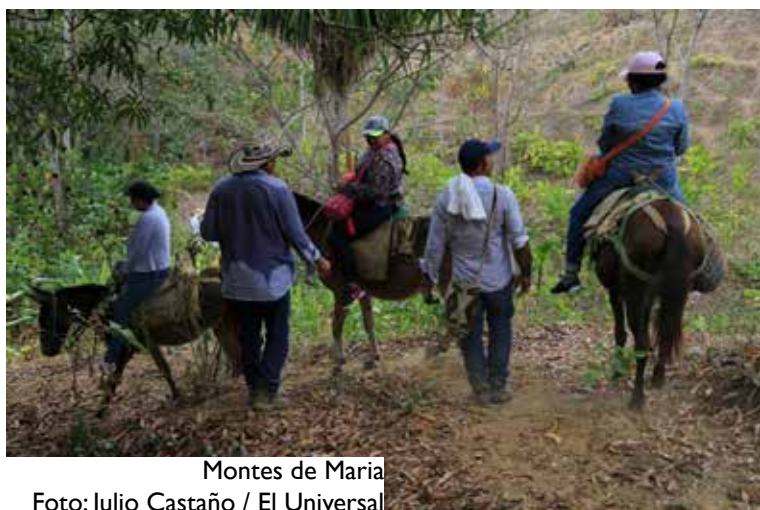
Montes de María