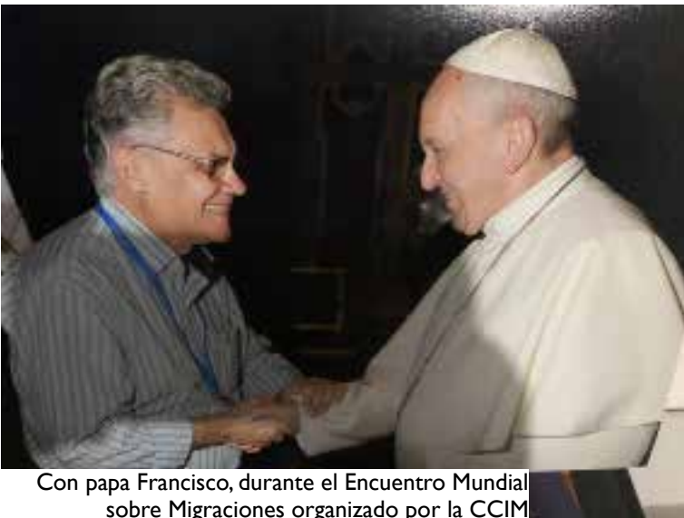
Con papa Francisco, durante el Encuentro Mundial sobre Migraciones organizado por la CCIM

Él tiene la última palabra. Es una gran oportunidad de reaprender a vivir y a convivir con todas las creaturas del organismo vivo que es la Madre Tierra. Aprovechémosla; el planeta está muy agradecido con el Coronavirus.