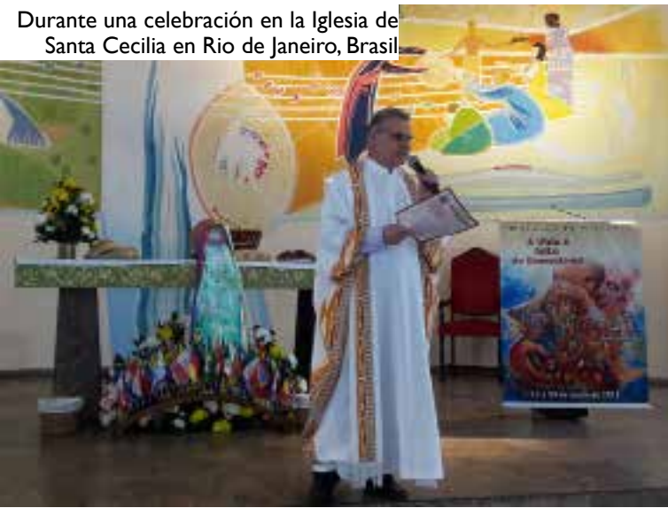
Durante una celebración en la Iglesia de Santa Cecilia en Rio de Janeiro, Brasil

Muchas cosas se pueden y deberían cambiar en todos los niveles y para toda la humanidad, pero es necesario voluntad política, coraje profético y participación de todas las personas. Creo que en este contexto del COVID-19 está naciendo una nueva consciencia cósmica de que somos peregrinos y migrantes en la tierra, en donde no somos dueños de nada ni de nadie. Somos limitados, dependientes uno de otros y solo juntos en comunidad nos salvaremos. Ojalá podamos aprender que lo más importante es cuidar la vida, amar las personas y creer que Dios resucitó y está vivo, por lo tanto,