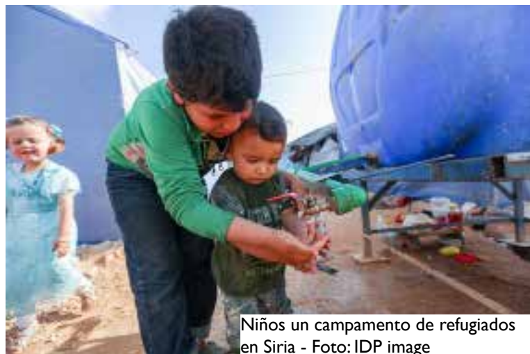
Niños un campamento de refugiados en Siria