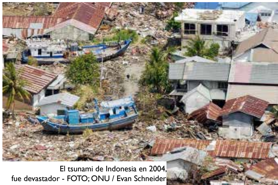
El tsunami de Indonesia en 2004, fue devastador

Aunque todavía no se trate de una expresión institucionalizada, ya existe un esfuerzo mundial (como la Iniciativa Nansen) para que se traduzca en acciones directas sobre poblaciones vulnerables