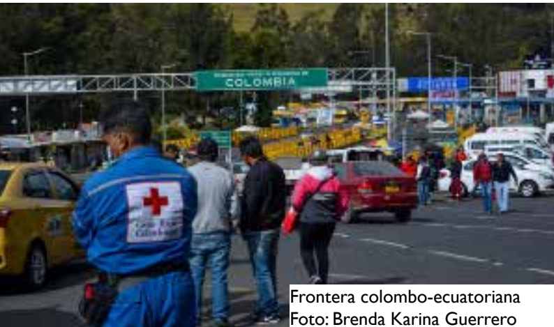
Frontera colombo-ecuatoriana

E l informe entregado por Migración Colombia a corte del 31 agosto reveló que la cifra de venezolanos radicados en el país aumentó en 35 por ciento respecto al 2018. La autoridad migratoria señaló que para la mayoría de los migrantes los destinos siguen siendo las principales ciudades: En Bogotá hay más de 357.000. Cúcuta, Barranquilla, Medellín y Cali siguen a la capital entre los principales destinos.