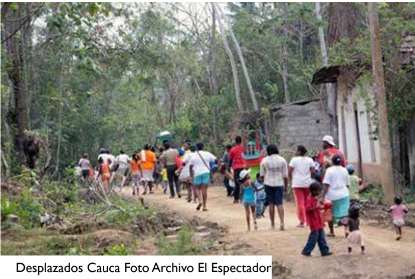
Desplazados Cauca

“Un reporte de la Oficina para la Coordinación de Asuntos Humanitarios (Ocha) de las Naciones Unidas dio a conocer que en tan solo cinco días de la semana anterior se desplazaron 225 personas entre niños y adultos, del departamento de Córdoba (ndr), por cuenta de intimidaciones de las disidencias de las Farc en complicidad con los ‘Caparrapos’.