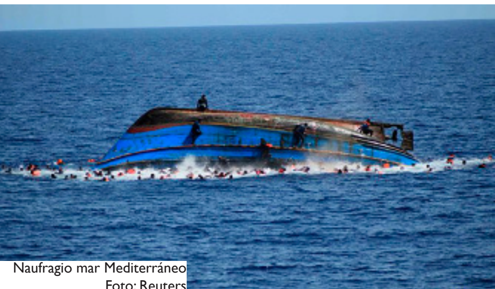
Nafragio mar Mediterráneo

T res noticias sobre la movilidad humana, recientes y preocupantes, están llamando a nuestra puerta. La primera viene de Europa; en un nuevo naufragio entre Libia y el sur del Viejo Continente a fines del pasado mes de julio, unos cien inmigrantes se ahogaron. El mes de julio, contabilizó además más de 600 ahogamientos en las aguas del Mediterráneo. No sin razón se le ha llamado durante mucho tiempo “cementerio de migrantes”.