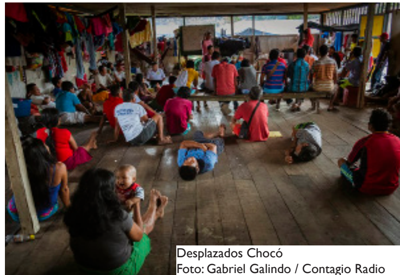
Desplazados Chocó