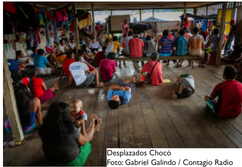
Desplazados Chocó