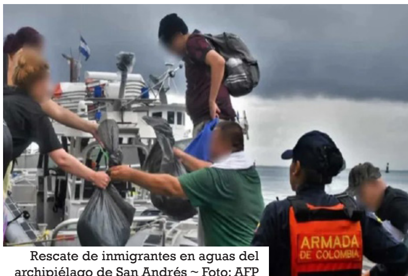
Rescate de inmigrantes en aguas del archipiélago de San Andrés ~ Foto: AFP

"Entendemos que los controles han disuadido a muchas personas a seguir utilizando nuestro país como ruta. Han surgido rutas alternativas a través de Colombia, que es irse hasta la isla de San Andrés y de ahí alquilar botes de manera irregular hasta Nicaragua", afirmó Ábrego.