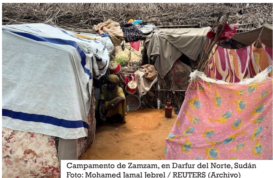
Campamento de Zamzam, en Darfur del Norte, Sudán

Las inundaciones en la región de Darfur también están afectando la ya limitada capacidad de las agencias de ayuda para llegar a las personas necesitadas, en aquellas áreas donde de otra manera sí hay