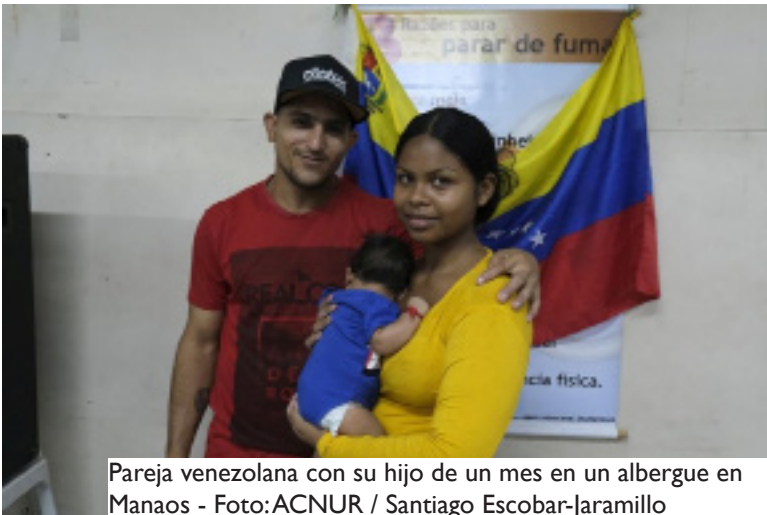
Pareja venezolana con su hijo de un mes en un albergue en Manaus

de reconocer a miles de venezolanos como refugiados