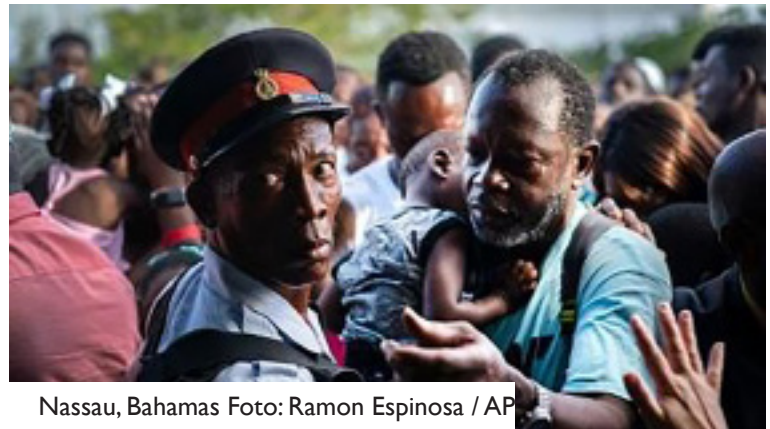
Nassau, Bahamas

los migrantes haitianos en Bahamas se enfrentan a la deportación y el estigma