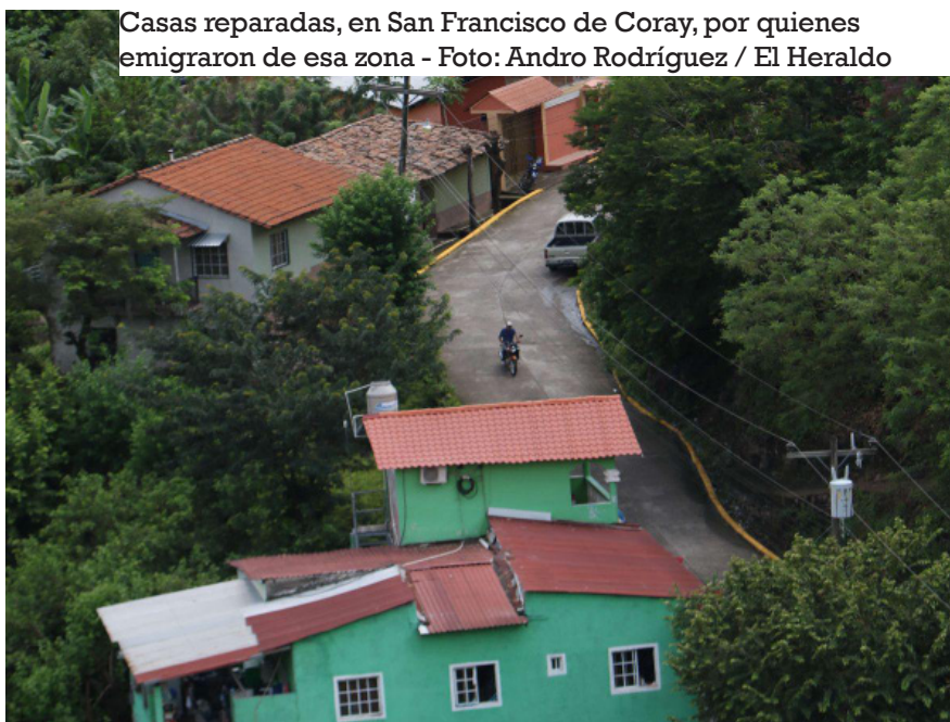
Casas reparadas, en San Francisco de Coray, por quienes emigraron de esa zona

Este oficio es tan cotizado que personas de otros municipios se