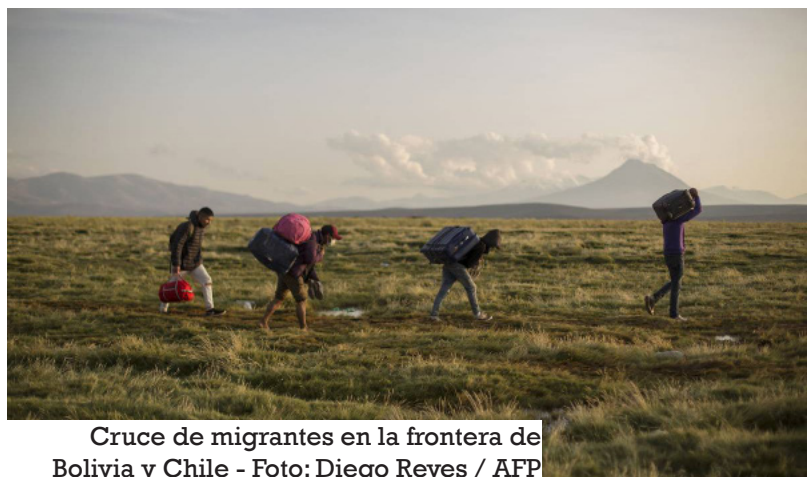
Cruce de migrantes en la frontera de Bolivia y Chile

Como es esperable, las características de la población migrante han ido cambiando desde que se inició el proceso migratorio. La prime-