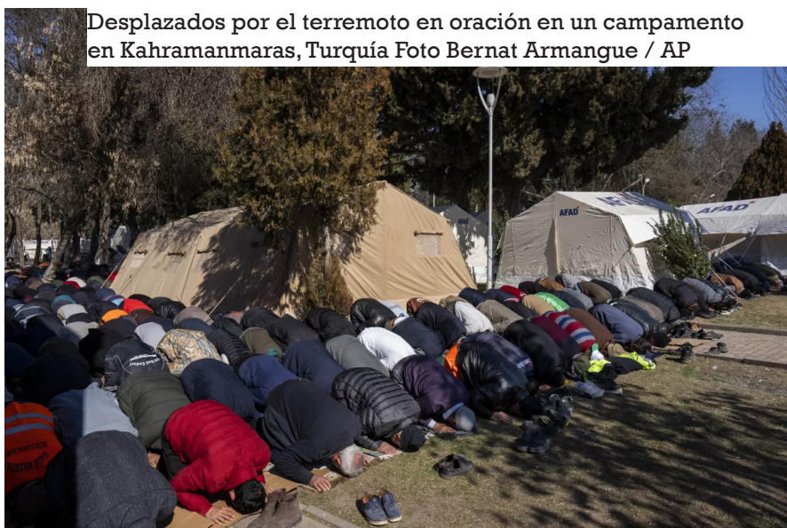
Desplazados por el terremoto en oración en un campamento en Kahramanmaras, Turquía

A este país que lleva 12 años sumido en una crisis profunda que, ha provocado 6,8 millones de desplazados internos, se le suma la tragedia del terremoto que complica muchísimo más su situación. Se estima que en Siria hay 5,3 millones de personas afectadas por el terremoto y por eso, ACNUR se está centrando en ofrecer artículos de refugio y socorro asegurándose que los centros colectivos donde están los desplazados cuenten con las instalaciones adecuadas. Además, están distribuyendo kits de artículos básicos de socorro (mantas térmicas, colchones, láminas plásticas y colchonetas), tiendas de campaña para familias y prendas de abrigo para soportar las bajas temperaturas en Aleppo, Homs y Tartous.