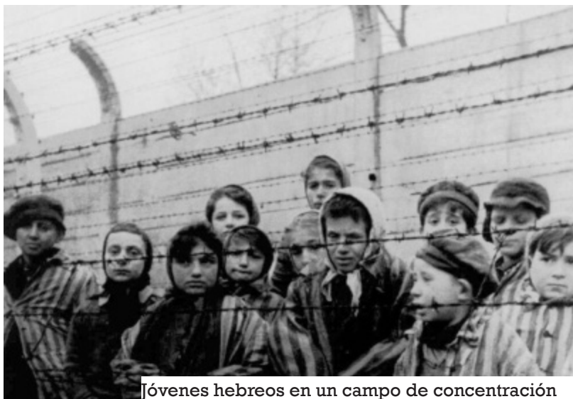
Jóvenes hebreos en un campo de concentración

Es por eso que cuando los Ministros del Interior de los 27 países de la UE, para contrarrestar el crecimiento de los flujos migratorios en la Unión Europea (330,000 entradas irregulares en 2022), elaboran casi exclusivamente medidas policiales y represivas, como la construcción de nuevos muros