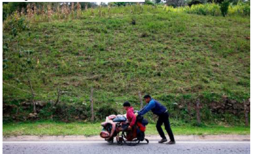
Migrantes venezolanos

Con la retoma de relaciones bilaterales el contexto cambió y no tenemos una respuesta en política pública para los nuevos desafíos. No hay una política para el abordaje de la migración pendular en las zonas de frontera con Venezuela. La normalización de la frontera entre Norte de Santander y Táchira trae consigo una alta presión sobre los servicios sociales de las ciudades y municipios de fronterizos, particularmente en salud y educación sin que se tenga un plan de respuesta claro y coordinado.