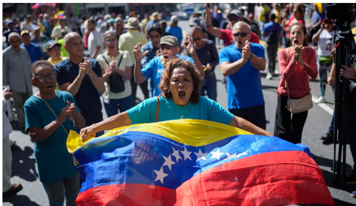
Protestas en Caracas, el jueves 9 de enero de 2025

El éxodo venezolano no se ha detenido, y los recientes acontecimientos políticos han generado un nuevo incremento en la salida de ciudadanos