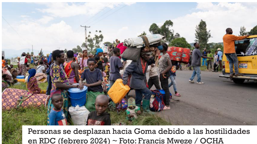
Personas se desplazan hacia Goma debido a las hostilidades en RDC (febrero 2024)

N o hay nada más fundamental para la condición humana que la necesidad de seguridad. Hace trescientos cincuenta años, en medio de la guerra civil inglesa, Thomas Hobbes recordó a sus conciudadanos que sin seguridad la vida no sería más que una “guerra de todos contra todos”, en la que la vida sería “desagradable, brutal y corta”. Para demasiadas personas del mundo, la inseguridad es la norma, no la excepción. Es causada por la pobreza profunda, las enfermedades físicas y mentales, la agitación social, la marginación económica, los conflictos físicos violentos, ya sean personales o políticos, los desastres naturales, el cambio climático y otros factores.