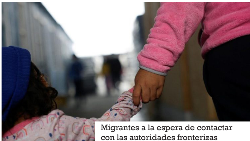
Migrantes a la espera de contactar con las autoridades fronterizas

M omentos de “angustia, dolor, miedo” ante las últimas disposiciones de Estados Unidos sobre migración. Es lo que están viviendo en estas horas los migrantes en México, según una nota de la Conferencia Episcopal del país latinoamericano (CEM). A poco más de una semana de la toma de posesión del presidente Donald Trump en el Despacho Oval, el control del jefe de la Casa Blanca sobre la inmigración va tomando forma, desde la emergencia nacional en la frontera sur hasta las repatriaciones con esposas y cadenas en aviones militares a los países de origen de los migrantes, pasando por la suspensión de la app Cbp One que permitía reservar citas para intentar obtener la entrada legal en EEUU: la interrupción del servicio ha bloqueado de hecho la salida de 33.000 personas de la nación latinoamericana, según una estimación de la prensa mexicana.