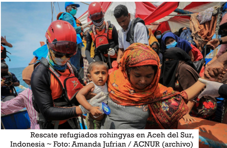
Rescate refugiados rohingyas en Aceh del Sur, Indonesia ~ Foto: Amanda Jufrian / ACNUR (archivo)

E stá preocupado por sus padres y hermanos, quienes permanecen en el campamento de desplazados internos del estado occidental de Rakhine, en Myanmar, donde pasó los últimos 13 años. La vida ahí nunca fue fácil, pero desde finales de 2023, los residentes del campamento y las comunidades de todo el estado de Rakhine están pagando un alto precio en medio de un recrudecimiento del conflicto.