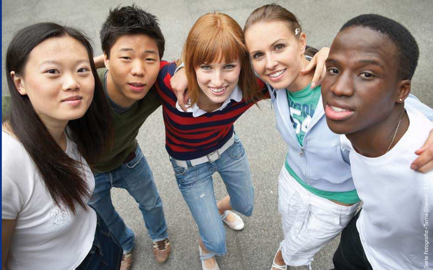
Serie Fotografia - Tema Giovani - 2/1/14