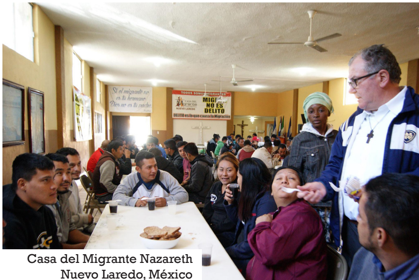
Casa del Migrante Nazareth Nuevo Laredo, México

Con voluntarios intentamos proporcionar atención médica, también a través de contactos con el sistema sanitario del gobierno. Además, contamos con abogados que acompañan a los migrantes en el proceso de solicitud de asilo en México. Y les damos la posibilidad de ir a trabajar: por ejemplo, aquí en Ciudad de México estamos cerca del mayor mercado del país, donde pueden ir a intentar ganar algo de dinero para sus necesidades personales. Si no ofreciéramos estos servicios, estas personas seguirían en una situación mucho más vulnerable, en la calle, con el peligro de que el crimen organizado que se dedica