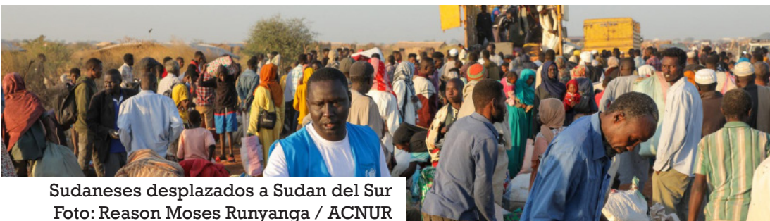
Sudaneses desplazados a Sudán del Sur

ACNUR y la OIM han estado proporcionando transporte, asistencia en efectivo, refugios temporales, artículos básicos, atención médica y servicios psicosociales. Sin embargo, la magnitud del desplazamiento ha sobrecargado los recur-