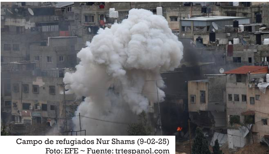
Campo de refugiados Nur Shams (9-02-25)

E n el séptimo día del asalto israelí al campo de refugiados de Al Faraa, en el sur de Tubas, en el norte de Cisjordania ocupada, un funcionario palestino ha confirmado que aproximadamente 400 palestinos han sido desplazados debido a las operaciones militares en curso.