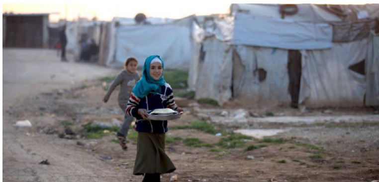
Campo de desplazados internos Maaret Elekhwan en Idlib (Siria)