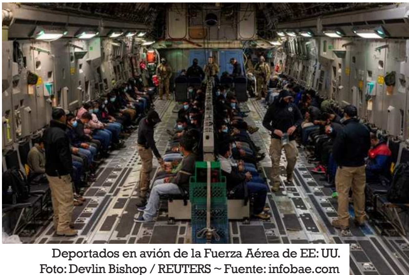
Deportados en avión de la Fuerza Aérea de EE: UU.