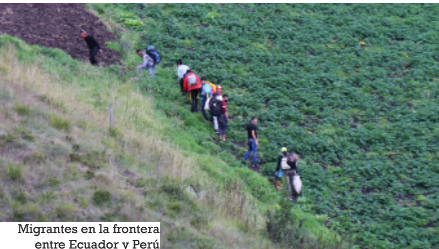
Migrantes en la frontera entre Ecuador y Perú

C IUDAD DEL VATICANO – En Huaquillas, ciudad ecuatoriana fronteriza con Perú, conocida como “Centinela sin relevo” por su situación geográfica sobre el Océano Pacífico y sus antecedentes históricos en la defensa de la nación, hoy pesa el drama humano de miles de migrantes, en su mayoría venezolanos. Cáritas Ecuador advierte sobre la gravedad de la situación planteada desde que a finales de enero de 2021, el gobierno peruano ordenó la militarización de la frontera para detener a los llamados “caminantes”.