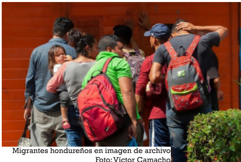
Migrantes hondureños en imagen de archivo

C IUDAD DE MÉXICO – La violencia es una de las principales causas por la cual miles de personas originarias de Guatemala, El Salvador y Honduras abandonan su país y solicitan refugio en México, país que cada vez más es visto como lugar de destino para esta población vulnerable, y no como punto de tránsito hacia Estados Unidos, reveló un informe de la Agencia de Naciones Unidas para los Refugiados (ACNUR).