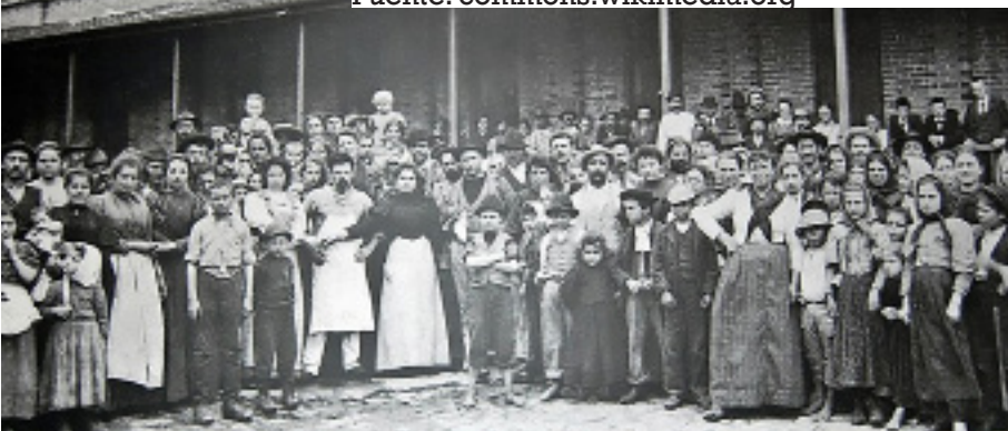
Inmigrantes en el patio de la "Hospedaria dos Imigrantes" de Sao Paulo (cerca de 1890)

"En relación con la inmigración italiana en el estado de São Paulo, donde el P. Marchetti y varios misioneros scalabrinianos trabajaron después de 1896, vale la pena recordar que los italianos, con alrededor de 1.000.000 de individuos, en 1890, representaron el 40% de toda la inmigración en el estado de São Paulo. En ciertos períodos, esta propor-