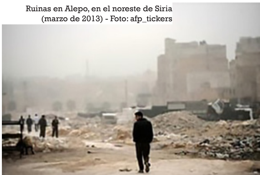
Ruinas en Alepo, en el noreste de Siria (marzo de 2013)