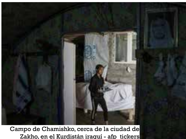
Campo de Chamishko, cerca de la ciudad de Zakho, en el Kurdistán iraquí

Cerca de las oficinas de la administración, decenas de hombres y mujeres hacen fila frente a un camión que