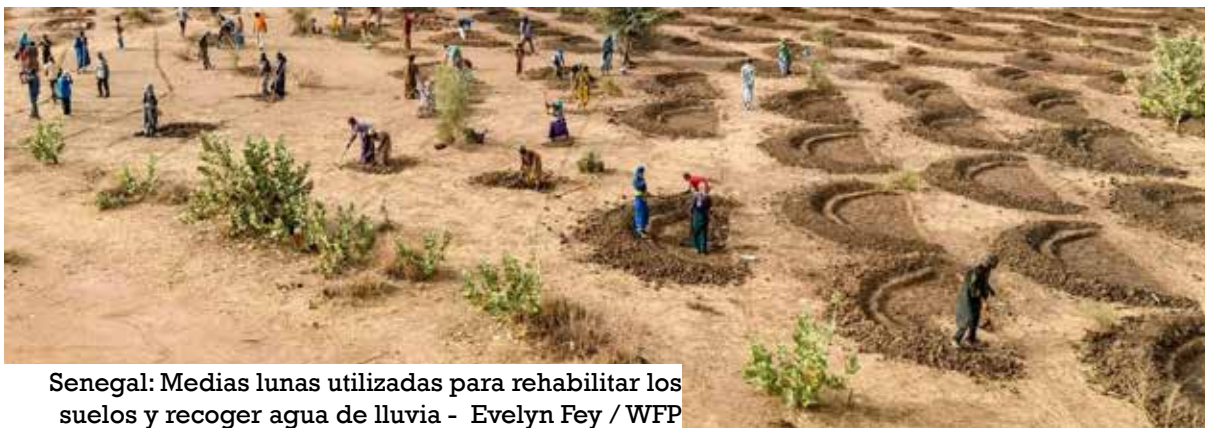
Senegal: Medias lunas utilizadas para rehabilitar los suelos y recoger agua de lluvia

L a guerra en Ucrania está agravando una “triple crisis alimentaria, energética y financiera” en toda África, según el Secretario General de la ONU, António Guterres.