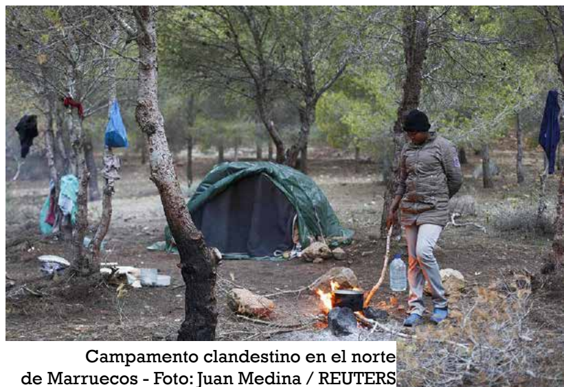
Campamento clandestino en el norte de Marruecos

Cabe destacar que, en su mayoría, los refugiados sirios constituyen la comunidad más grande de asilados en el país norteafricano. Las cifras apuntan a que residen ya en Marruecos unas 5.150 personas de esta etnia. La presencia de sirios lleva bastante tiempo siendo la mayoritaria en el Reino. El Alto Comisionado para la Planificación (HCP) realizó en 2021 una encuesta sobre la migración forzada en el país donde reveló que uno de cada dos refugiados era de origen sirio. Esta población representa el 54,4% del número total de refugiados.