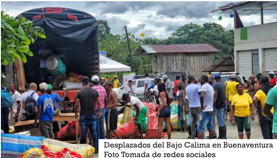
Desplazados del Bajo Calima en Buenaventura