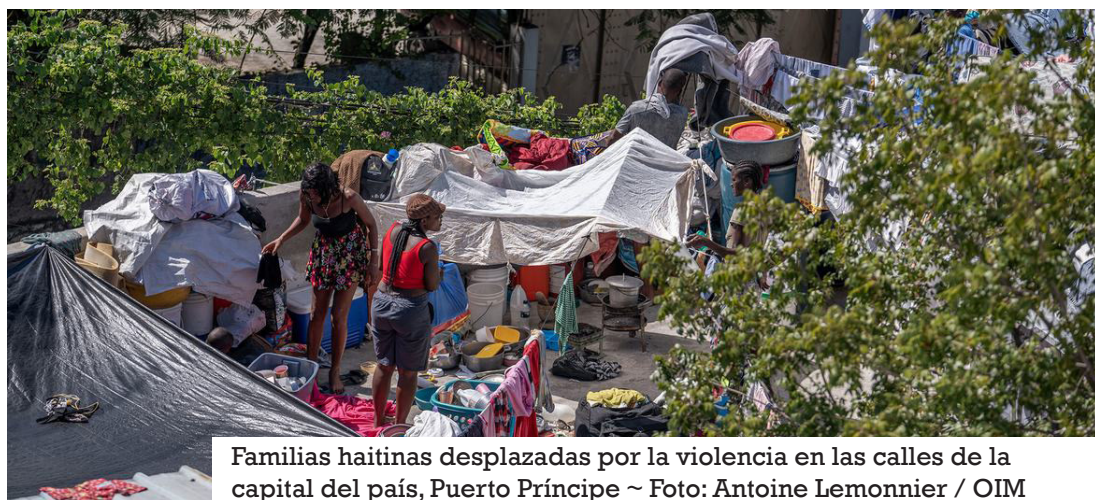
Familias haitinas desplazadas por la violencia en las calles de la capital del país, Puerto Príncipe

Pope refirió el caso de una mujer que le contó que había huido de su barrio tres veces en dos