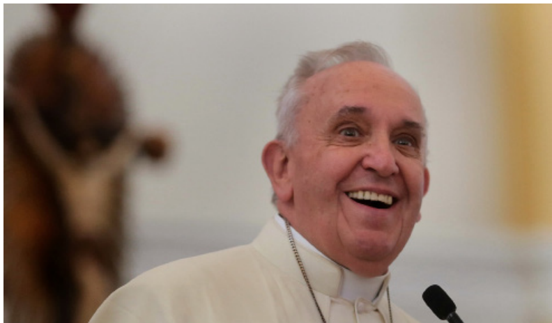
Papa Francisco en la catedral de Palo, Filipinas ~ Foto: Benhur Arcayan Malacañang - Photo Bureau en commons.wikimedia.org

La atención a las personas más vulnerables fue el corazón de su acción pastoral. Para él, los miles de personas que se vieron obligadas a abandonar su tierra no son números, sino rostros, historias, personas. “No se trata solo de migrantes, se trata de nuestra humanidad», repetía a menudo, invitando a la sociedad civil a superar el miedo y a construir una cultura del encuentro. Para Francisco, la Iglesia no es una institución cerrada, sino un cuerpo vivo en movimiento, dispuesto a salir al encuentro y a hacerse cercano. “Prefiero una Iglesia accidentada, herida y sucia por haber salido a la calle, que una Iglesia enferma por el encierro», escribía en Evangelii Gaudium . Es una invitación a no quedarse inmuebles, a no tener miedo de caminar por las periferias