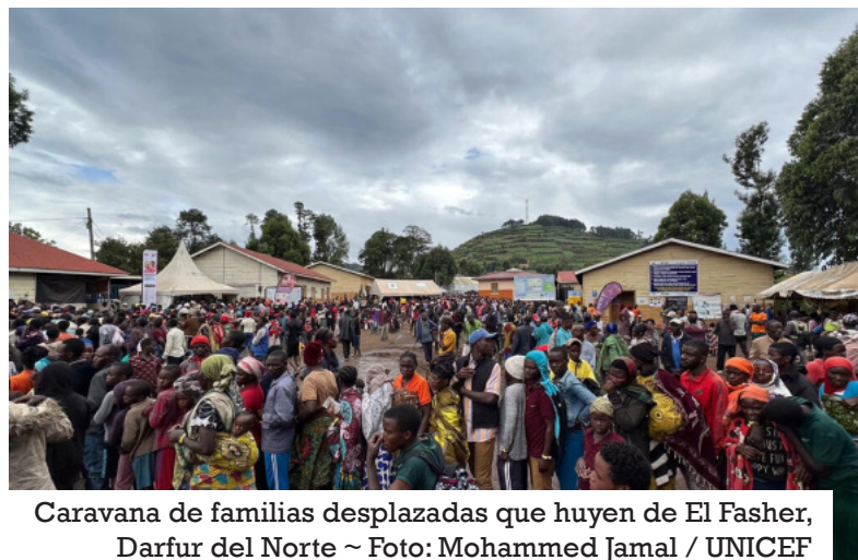
Caravana de familias desplazadas que huyen de El Fasher, Darfur del Norte ~ Foto: Mohammed Jamal / UNICEF

G INEBRA – Uganda, el mayor país de acogida de refugiados en África, está experimentando un fuerte aumento en el número de refugiados congoleños que cruzan su frontera occidental debido a la creciente inseguridad en la parte oriental de la República Democrática del Congo (RDC). En el actual contexto de recortes de financiación, este importante aumento en las llegadas de refugiados corre el riesgo de sobrecargar la capacidad del país, que responde simultáneamente a las necesidades de más de 70.000 refugiados sudaneses que han llegado huyendo de dos años de guerra en Sudán.