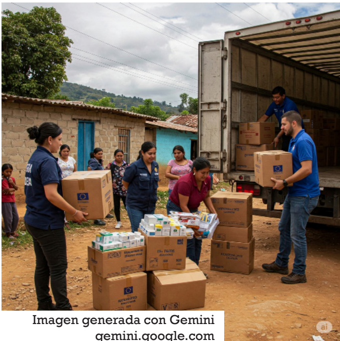
Imagen generada con Gemini gemini.google.com

Lahbib, exministra de Exteriores belga, informó que para Venezuela se destinarán 38 millones de euros, el monto más alto de la UE, para organizaciones humanitarias, por la crisis que atraviesa el país.