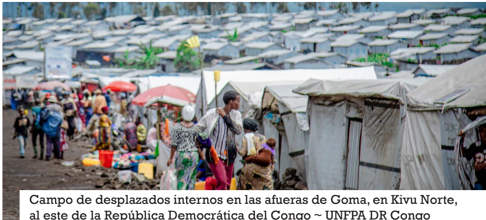
Campo de desplazados internos en las afueras de Goma, en Kivu Norte, al este de la República Democrática del Congo

Otros 9,8 millones de personas vivían desplazadas internamente a finales de año tras verse obligadas a huir por catástrofes, lo que supone un aumento del 29% respecto al año anterior y más del doble que hace tan sólo cinco años. Afganistán (1,3 millones) y Chad (1,2 millones) representaban juntos casi una cuarta parte del total.