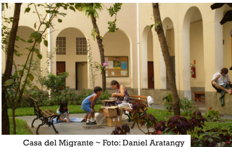
Casa del Migrante