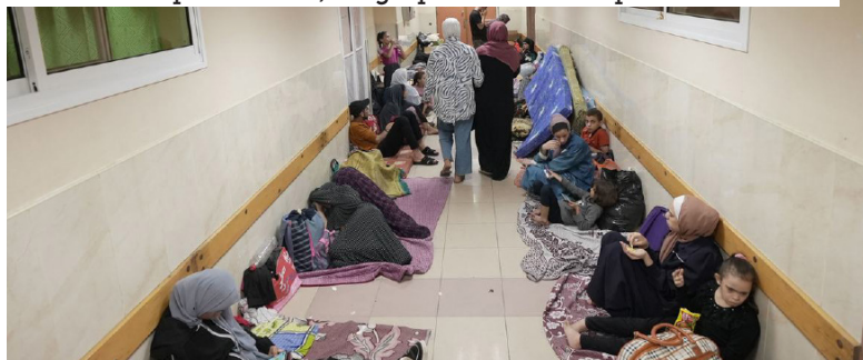
OMS / Hospital Al Shifa, refugio para familias desplazadas en Gaza

En los tres meses que van de junio a finales de septiembre, ACNUR calcula que el número de desplazados forzados aumentó en 4 millones, lo que eleva el total a 114 millones. El conflicto en Oriente Medio estalló el 7 de octubre, más allá del periodo cubierto por este informe, que por tanto no tiene en cuenta sus consecuencias en términos de desplazamientos humanos.