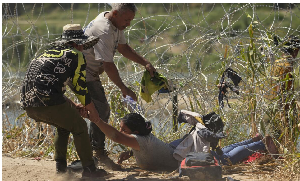
Río Bravo, 21 de septiembre de 2023, en Eagle Pass, Texas

L a situación migratoria con la llegada de siete millones de personas desde 2020 a la frontera entre México y Estados Unidos, con siete mil personas a diario en 2023, clasifica como crisis. La manifestación de esta migración sobre el entorno es tan fuerte que su contención escapa al control y la capacidad de manejo de expertos y autoridades en Estados Unidos. Esa dificultad en contener la movilidad se derrama sobre otros espacios, como el de ciudades que quedan saturadas de migrantes en sus centros de albergue, con sistemas de protección social presionados por falta de abasto, o con aumento de basura en las calles.