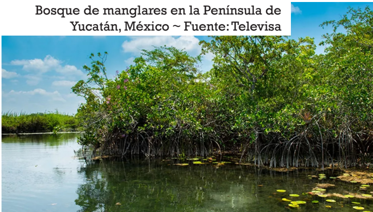
Bosque de manglares en la Península de Yucatán, México

Entre las medidas de adaptación más conocidas están la construcción de infraestructuras más seguras, sostenibles y resilientes, la conservación y restauración de bosques y ecosistemas naturales, la aplicación de soluciones basadas en la naturaleza, la gestión de riesgos ante desastres naturales o la diversificación de cultivos.