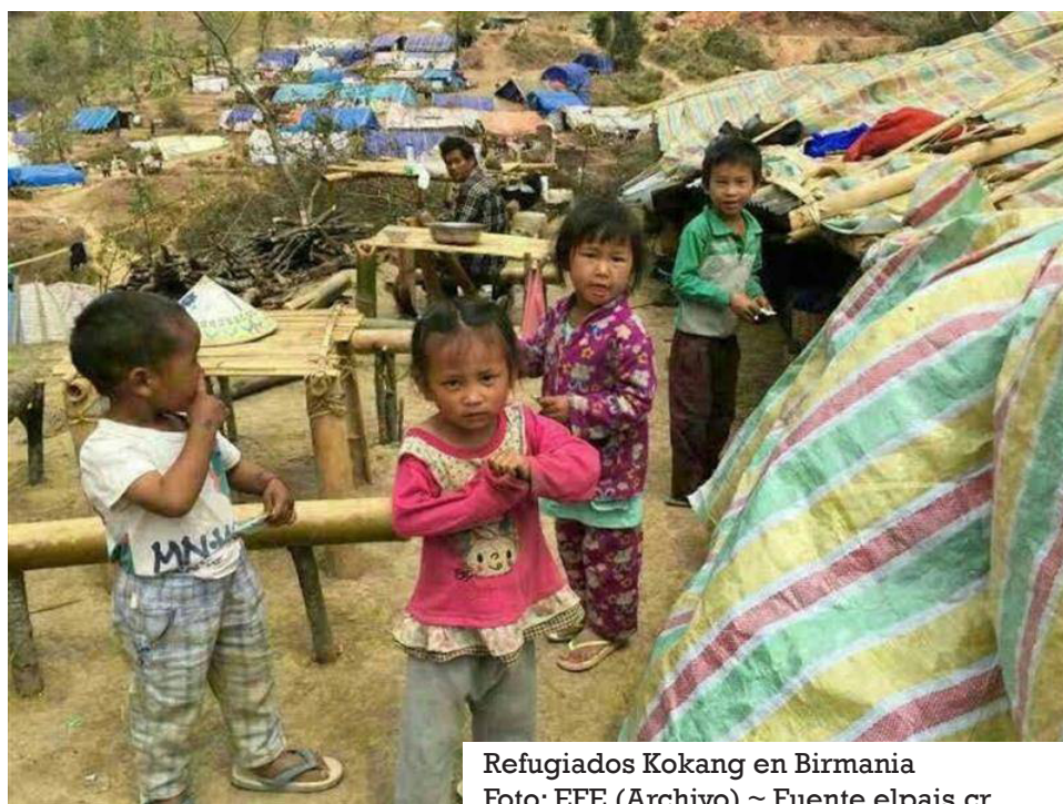
Refugiados Kokang en Birmania

B ANGKOK / EFE – Unas 90.000 personas han sido desplazadas de sus hogares a raíz de la ofensiva iniciada a finales de octubre por una alianza de guerrillas étnicas contra la junta militar en el estado Shan, noreste de Birmania, informa este viernes la Oficina de la ONU para la Coordinación de Asuntos Humanitarios (OCHA).