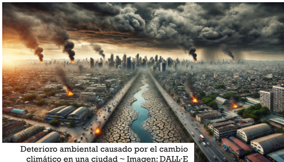
Deterioro ambiental causado por el cambio climático en una ciudad