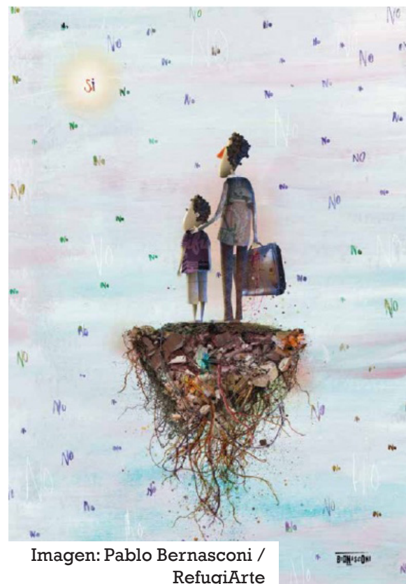
Imagen: Pablo Bernasconi / RefugiArte

Esta agitación febril de la humanidad, al sacudir las placas tectónicas de la economía capitalista de la ganancia y el mercado, sacude también las ondas superficiales, provocando así desplazamientos de masas humanas cada vez más frecuentes. Y, al mismo tiempo, más intenso, diversificado y complejo. De esto se puede concluir que el fenómeno migratorio en su conjunto, si en décadas pasadas tenía un origen y un destino más o menos predeterminados, hoy en día los migrantes comienzan a deambular por los caminos sin saber dónde replantar las raíces arrancadas a la fuerza. En una palabra, la migración es cada vez más incierta, más insegura y más preocupante. En los caminos y horizontes de los migrantes, las nubes se acumulan y se espesan oscuramente. Desde esta perspectiva, las tres caras del “derecho a ir y venir”, como hemos visto más arriba, se reducen a una mera fuga, a menudo acelerada por las bombas, el hambre o las dramáticas sequías e inundaciones. De hecho, si estas tres alternativas no están presentes al mismo tiempo, solo