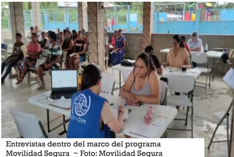
Entrevistas dentro del marco del programa Movilidad Segura

Movilidad Segura es una iniciativa del Gobierno de Estados Unidos, respaldada por la Agencia de las Naciones Unidas para los Refugiados (ACNUR), la Organización Internacional para las Migraciones (OIM) y otros socios.