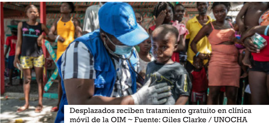
Desplazados reciben tratamiento gratuito en clínica móvil de la OIM

Por su parte, el empresario Alix Didier Fils-Aimé, que asumió oficialmente el sábado como el nuevo jefe de Gobierno de Haití, enfatizó la urgencia de su administración al afirmar que “no tenemos estado de gracia ni tiempo para la observación. Cada hora cuenta, cada día perdido es un golpe a las esperanzas de nuestro pueblo”.