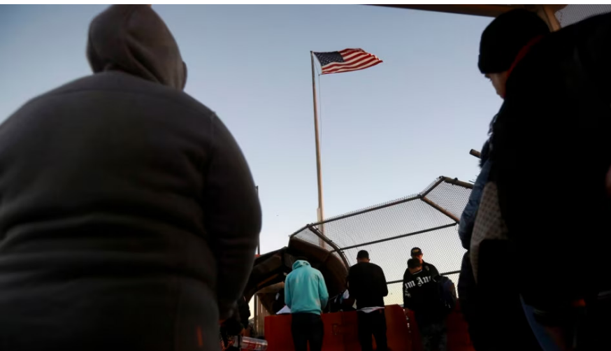
Migrantes en el puente internacional Paso del Norte

Según el alto funcionario, los países receptores tenían “prácticamente un control total” sobre a quiénes permitían ingresar formalmente, por lo que al aumentar las posibilidades de una “migración regular, ordenada y segura”, podrían ser capaces de gestionar mejor los flujos irregulares de personas.