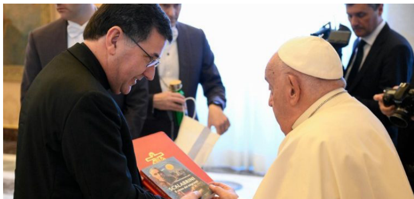
Papa Francisco con padre Chiarello, Superior General de los Misioneros Scalabrinianos

“No olvidemos el Antiguo Testamento: la viuda, el huérfano y el extranjero. Son los privilegiados de Dios.”