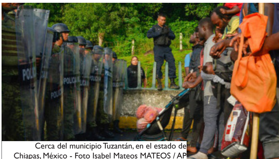
Cerca del municipio Tuzantán, en el estado de Chiapas, México

‘México se enfrenta a crecientes desafíos y preocu-