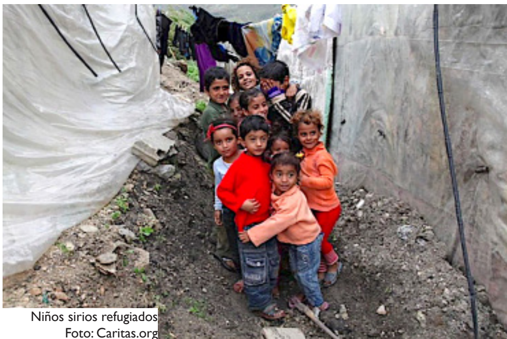
Niños sirios refugiados

Como en un espejo, en la 105 a Jornada mundial del migrante y refugiado, que se celebra el 29 de septiembre, pueden ser vistos como telón de fondo los debates de la Asamblea General de las Naciones Unidas. En esta última, las tensiones, diferencias y contradicciones son evidentes en los discursos y en la posición de cada jefe de Estado. De una parte, Donald Trump refuerza y predica el nacionalismo populista de la política adoptada por los Estados Unidos, con el derecho a la guerra comercial en confrontación con China. El presidente de Brasil, Jair Messias Bolsonaro, está cerca de él, insistiendo en un aislacionismo agresivo o en el “Fantasma del Socialismo”, ambos anticuados. Por otro lado, el Secretario General de las Naciones Unidas, António Guterres, defendiendo el multilatera-