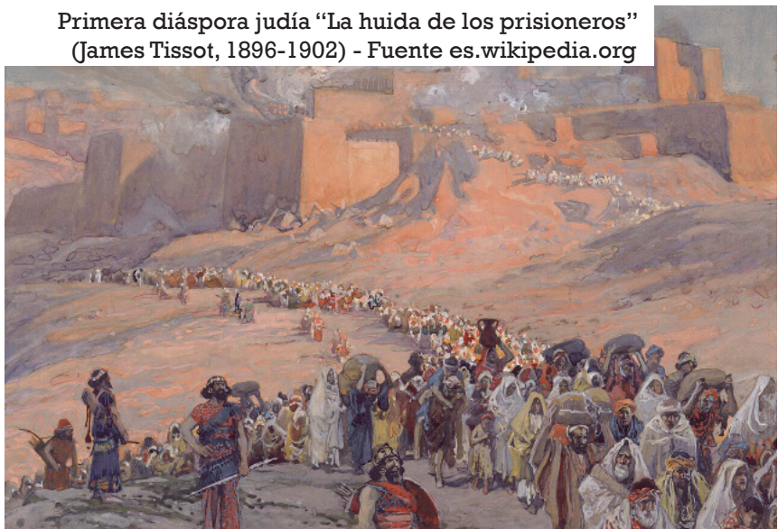
Primera diáspora judía “La huida de los prisioneros” (James Tissot, 1896-1902)

El hecho es que la historia se mueve. Y si se mueve, es porque millones de personas están en marcha. Tal marcha, además, representa la parte aparente y visible de las transformaciones ocultas e invisibles. Las sucesivas caravanas de migrantes y refugiados son como las olas superficiales de las corrientes subterráneas profundas. Al mismo tiempo, velan y revelan los cambios históricos y estructurales en curso, ya sean sociales, económicos, políticos o culturales. Cambios que, según estudiosos y expertos en el tema, han contribuido poderosamente a la concentración del ingreso y la riqueza, por un lado, y a la exclusión so-