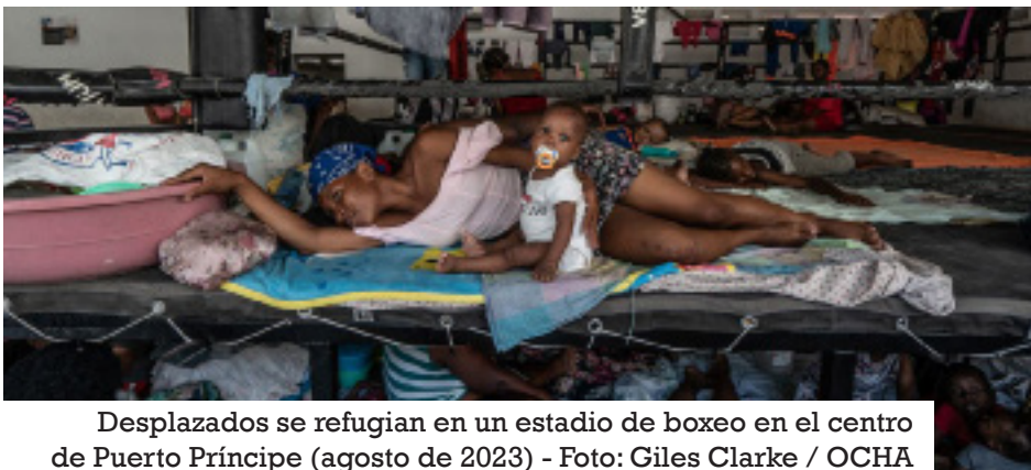
Desplazados se refugian en un estadio de boxeo en el centro de Puerto Príncipe (agosto de 2023)

La agencia de la ONU señaló que la capacidad de las familias de acogida para apoyar a la población desplazada se ha agotado dado lo prolongado de la crisis, ocasionando nuevos desplazamientos y mayor precariedad.