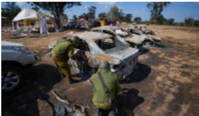
Soldados israelíes inspeccionan el sitio del festival de música atacado por Hamás

Alrededor de un millón de personas han sido desplazadas de sus hogares en la franja de Gaza por la guerra que estalló el sábado 7 de octubre después del ataque de la milicia palestina Hamás contra Israel, según ha indicado la agencia de la ONU para los refugiados palestinos (UNRWA). Más de 2.670 personas han muerto por los bombardeos sobre Gaza, que han continuado esta madrugada, y al menos 9.600 han resultado heridas. En Israel hay 1.400 fallecidos por los ataques de Hamás. 2