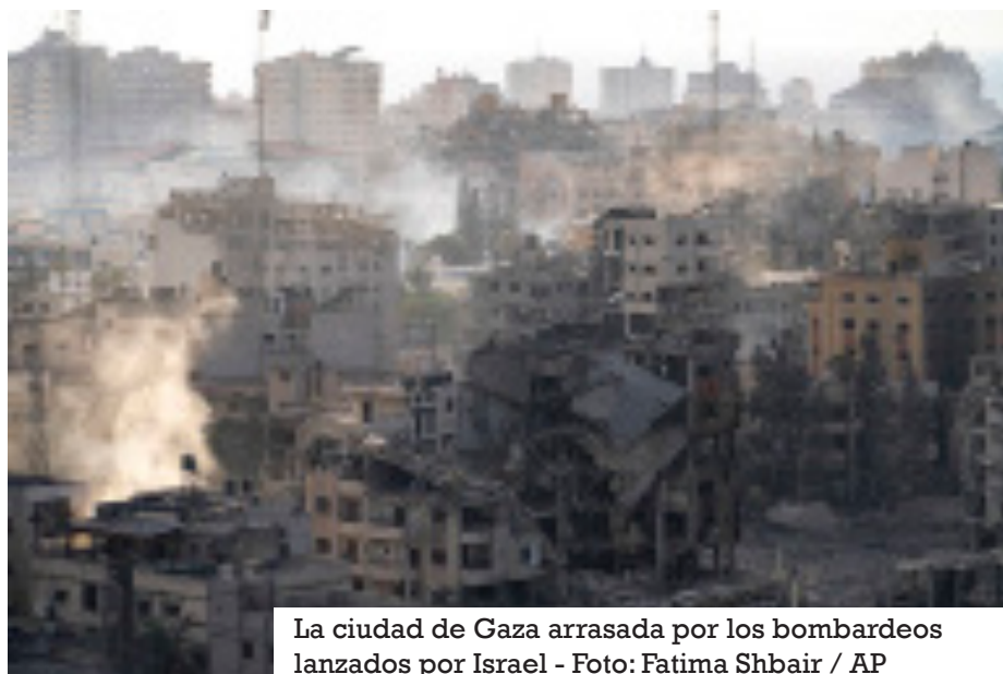
La ciudad de Gaza arrasada por los bombardeos lanzados por Israel

A pesar de que la mayoría de los hogares en la Franja de Gaza están conectados a una red de suministro de agua, la disponibilidad del recurso es muy limitada. Según la Oficina de Coordinación de Asuntos Humanitarios de las Naciones Unidas (OCHA), en 2017 las familias en Gaza recibieron agua corriente solo durante un período de seis a ocho horas cada cuatro días, una circunstancia atribuida principalmente a la escasez de energía. Esta ya de por sí limitada disponibilidad se vio aún más mermada con los sucesivos ataques en la región.