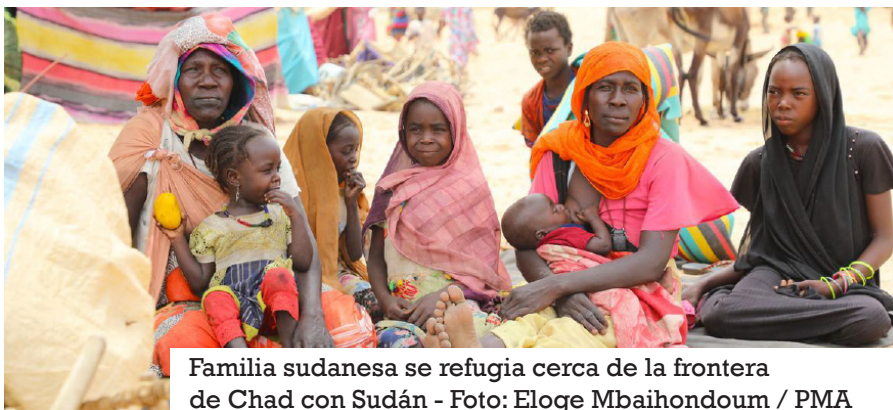
Familia sudanesa se refugia cerca de la frontera de Chad con Sudán - Foto: Eloge Mbaihondoum / PMA

Actualmente, 1 de cada 17 personas que viven en Chad es un refugiado, según dijo hoy la Oficina de Coordinación de Asuntos Humanitarios de Naciones Unidas.