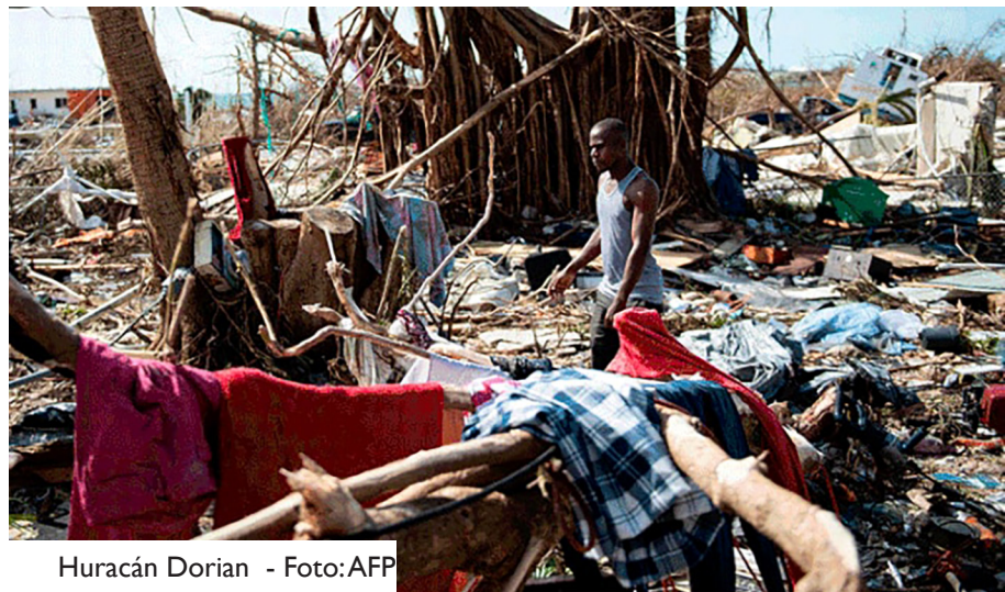
Huracán Dorian

El Centro para el Monitoreo del Desplazamiento Interno, una organización que recopila datos de