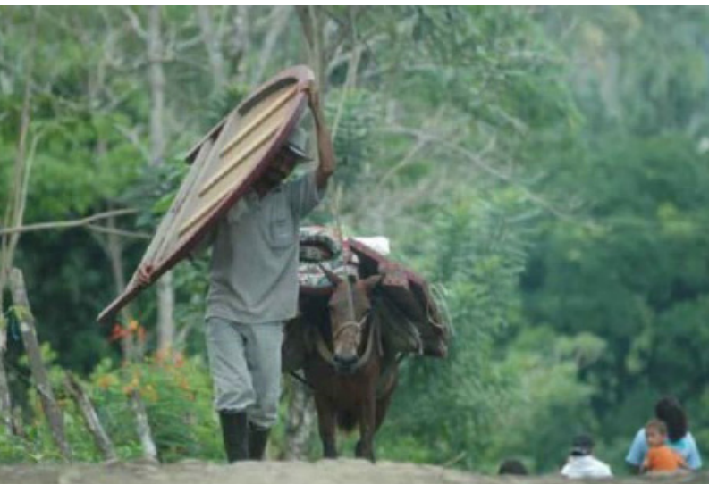
Desplazados de la zona rural

La Oficina de Asuntos Humanitarios de Naciones Unidas (OCHA) reveló en su más reciente informe que los fenómenos humanitarios causados por la violencia, como el desplazamiento forzado y el confinamiento, siguen con una tendencia al alza en el país durante este 2024.