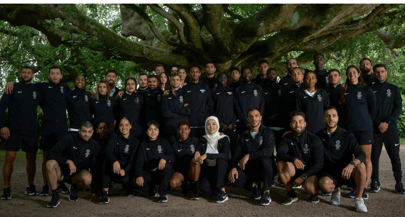
Equipo de Refugiados en los Juegos Olímpicos de París 2024 Olympic Refuge Foundation

La Junta Ejecutiva del Comité Olímpico Internacional es quien se encarga de seleccionar a los atletas que competirán en los Juegos Olímpicos. Los deportistas tuvieron que pasar por diversas pruebas y requerimientos, en las cuales demostraron ser atletas de alto rendimiento dentro de sus respectivas disciplinas deportivas. El apoyo financiero proviene del Programa de Becas para Atletas Refugiados.