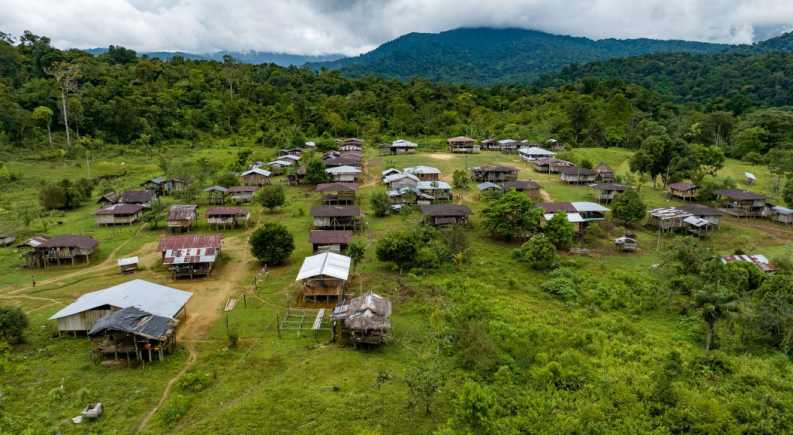
"Estamos atrapados", dice Cecil, un maestro indígena en la región del Pacífico de Colombia - Foto: Laboratorio Elegante / NRC

Hoy hay más personas confinadas que nunca, cientos de miles necesitan ayuda y brindar asistencia humanitaria es cada vez más difícil para los trabajadores humanitarios.