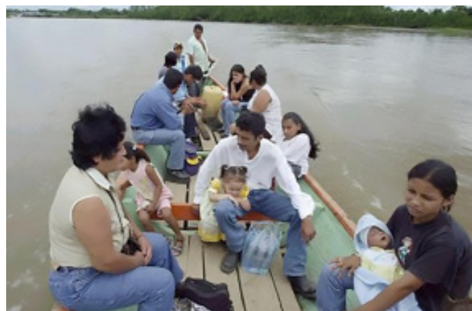
Foto de archivo. Familia colombiana desplazada en el departamento del Putumayo (2001).

“Son hechos que aterrorizan a la población con homicidios selectivos, reclutamiento y utilización de niños, niñas y adolescentes, amenazas y señalamientos y, en general, prácticas de sometimiento y control poblacional”, dijo el defensor al solicitar a las autoridades adoptar medidas eficaces para enfrentar el problema que afecta a comunidades negras, indígenas y campesinas.