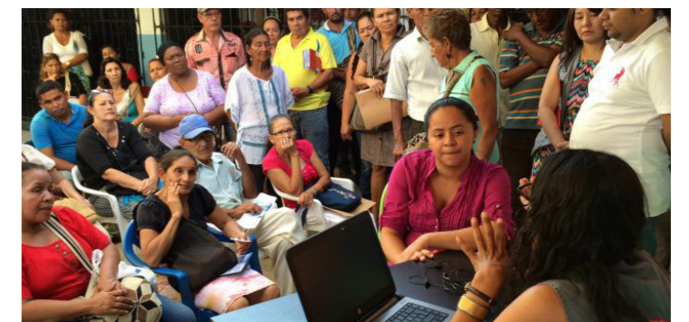
Santa Marta, Magdalena - Foto archivo: unidadvictimas.gov.co

MEG/COG/RAM Fuente: unidadvictimas.gov.co 16-11-22