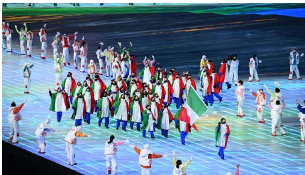
L'Italia nella sfilata inaugurale

"24 - Quella di Pechino è la 24esima edizione dei Giochi olimpici invernali. La prima si tenne a Chamonix nel 1924. Fino al 1992, la rassegna si disputava nello stesso anno delle Olimpiadi estive, poi, a partire da Lillehammer 1994, cominciò l'alternanza. Pechino è solo