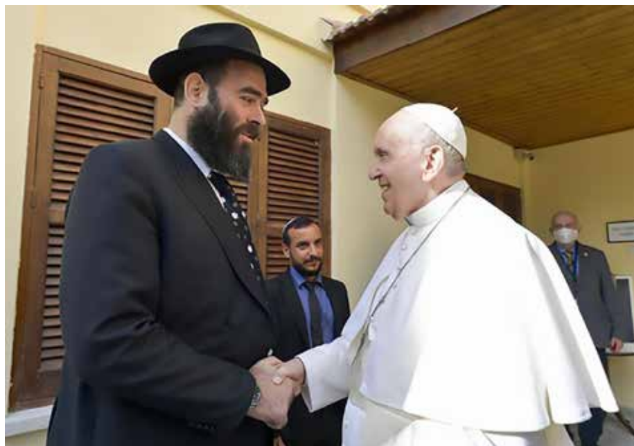
Papa Francesco con il Rabbino capo di Cipro