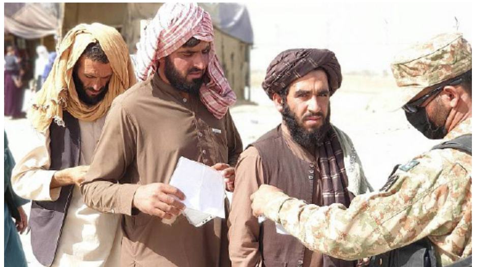
Rifugiati afgani al confine tra Afghanistan e Pakistan