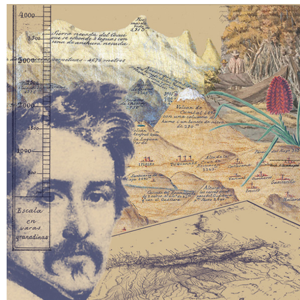
Immagine: "Las siete vidas de Agustín Codazzi"

Dobbiamo molto della nostra corografia al formidabile lombardo Giovanni Agostino Codazzi, che dopo aver combattuto nelle guerre napoleoniche giunse in Gran Colombia nel 1826 e si mise a disposizione di Simón Bolívar. Militare, geografo, cartografo ed etnologo, Codazzi studiò a fondo la nostra geografia e diresse la Commissione Corografica tra il 1850 e il 1859. Anche se si ammalò nel 1858, volle terminare tutta la corografia del Paese, così partì per la Costa Caraibica, regione che non aveva ancora coperto completamente, mostrando un particolare interesse per la Sierra Nevada de Santa Marta. In questo suo ultimo viaggio fu ospite del momposino don Óscar Tre-