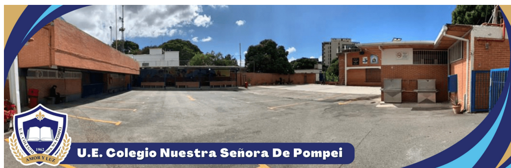
Foto: Chiesa e scuola a Caracas

Ho potuto constatare le eccellenti attività della Famiglia Scalabriniana nel settore scuola, una delle nostre priorità poiché, sin dal nostro arrivo, abbiamo subito fatto nostro il pensiero che i giovani venezuelani che bussano alla nostra porta saranno il futuro del Venezuela. Un “desafío” (una sfida, in italiano) come lo chiamano in spagnolo, tenendo in considerazione la grave inflazione che affligge il paese e le condizioni precarie degli insegnanti che sono pagati – appena – circa 9 dollari al mese.