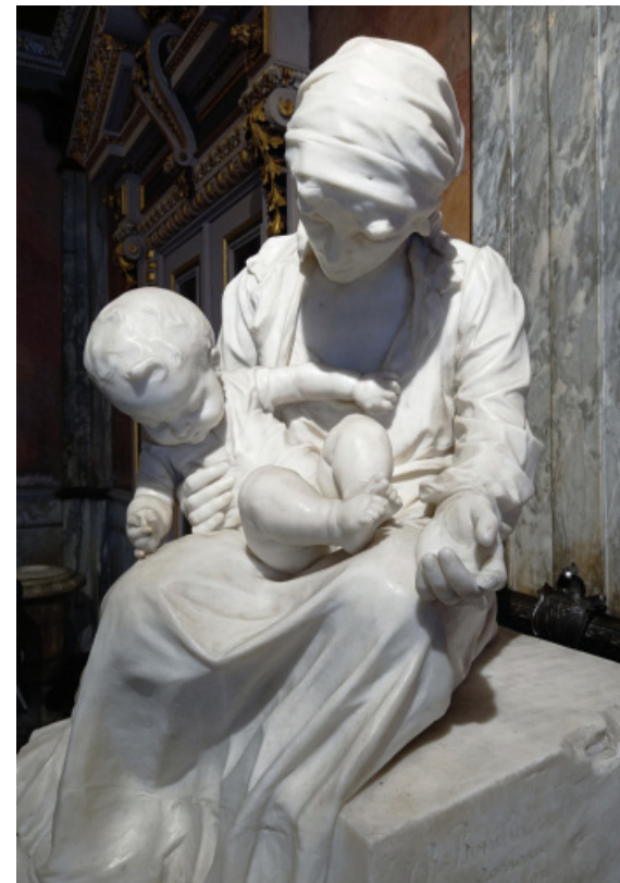
Los héroes de la miseria, di Juan Ramón Bonilla Aguilar, (1909)

Durante la costruzione del teatro molte delle parti strutturali furono contrattate all'estero e questo aveva comportato anche delle significative modifiche dei disegni originali. Tra queste, la grande cupola, le strutture metalliche, il meccanismo per alzare il pavimento del palcoscenico e le scale in marmo. Il sistema costruttivo, infatti, era stato progettato tenendo conto princi-