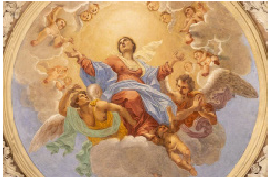
Affresco dell'Assunzione di Maria, di Giuseppe Craffonara

Insieme, alcune delle principali celebrazioni in Italia, terra di grandiose feste patronali, le cui tradizioni si tramandano da secoli.