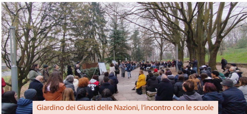
Giardino dei Giusti delle Nazioni, l'incontro con le scuole

La figura di padre Enrico Lido Mencarini (Lucca, 1916 - Hong Kong, 2007), missionario del P.I.M.E., si colloca oggi all'incrocio tra storia della Shoah, studi sulla resistenza civile e riflessioni contemporanee sulla memoria. La recente ricostruzione del suo operato durante gli anni 1941 - 1947, culminata nel riconoscimento presso il Giardino dei Giusti di Milano , offre un caso emblematico di come forme di solidarietà silenziosa abbiano contribuito alla salvaguardia della dignità umana in un contesto di persecuzione sistemica.