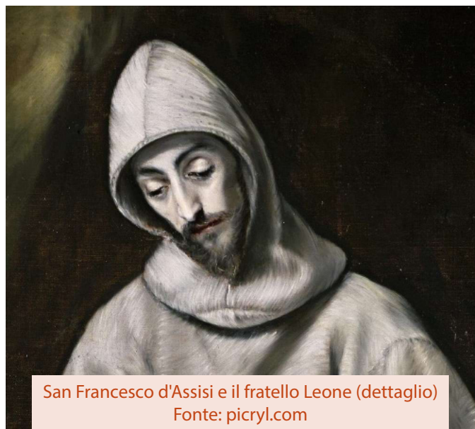
San Francesco d'Assisi e il fratello Leone (dettaglio)

Senza curarsi delle distanze geografiche né delle barriere religiose, egli incontrò in Egitto il Sultano Malik-el-Kamil. Questo gesto rappresenta uno dei pilastri per sensibilizzarci al tema della mobilità umana, proprio come ci ricordava Papa Francesco nella sua enciclica Fratelli Tutti . In essa, il Pontefice ci insegna che l'incontro con il "diverso" non deve essere uno scontro, bensì l'opportunità di riconoscere una dignità che va oltre ogni frontiera o condizione migratoria.