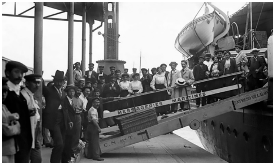
Arrivo di immigrati in Argentina

Ma quando la gente scappa dalla guerra le priorità cambiano. C'è bisogno innanzitutto di un posto dove dormire, vestiti per il freddo, acqua calda, qualcosa da mangiare e soprattutto un lavoro per